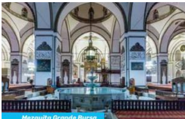
Mezquita Grande Bursa

(425 km) Desayuno. Salida Estambul vía Bursa que fue la primera capital del Imp Otomano. Bursa reconocida ciudad por sus mezquitas, fuentes, baños turcos y por la producción de seda. Visitaremos la Mezquita Grande del XIV, la Mezquita y el Mausoleo Verde y el bazar local de seda. Salida con destino a Estambul. Llegada al hotel de Estambul. Comidas: Desayuno